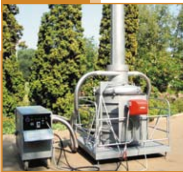
Фото 1. Установка термического обезвреживания отходов