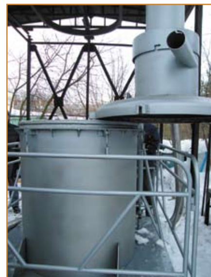
Фото 2. Поворот крышки с камерой дожигания установки ЭКО Ф2

Развернутая система очистки, включающей циклон, скруббер и другие элементы, заметно увеличивает стоимость установок, срок их изготовления, габаритные размеры, требует больших капитальных затрат на подготовку специального помещения. В установках серии ЭКО Ф эффективная очистка отходящих газов дости-